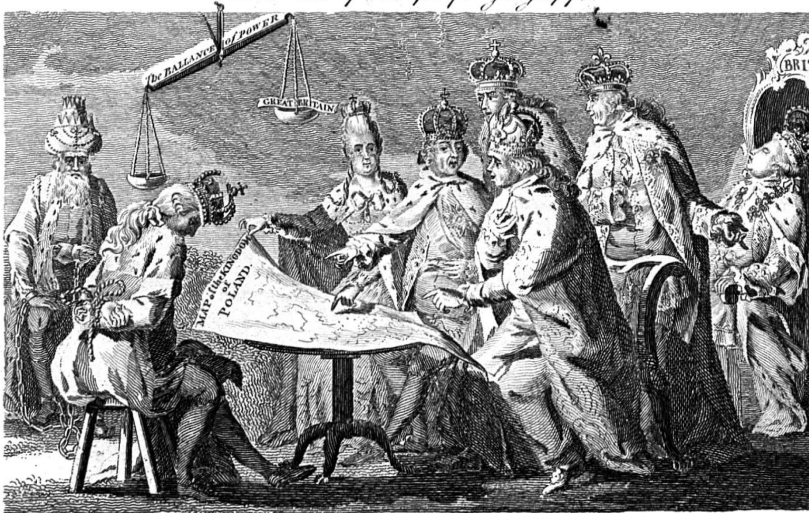
Picture of Europe for July 1772.